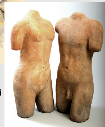
Eva Radek Skulpturen und Objekte (Raku und Bronze)